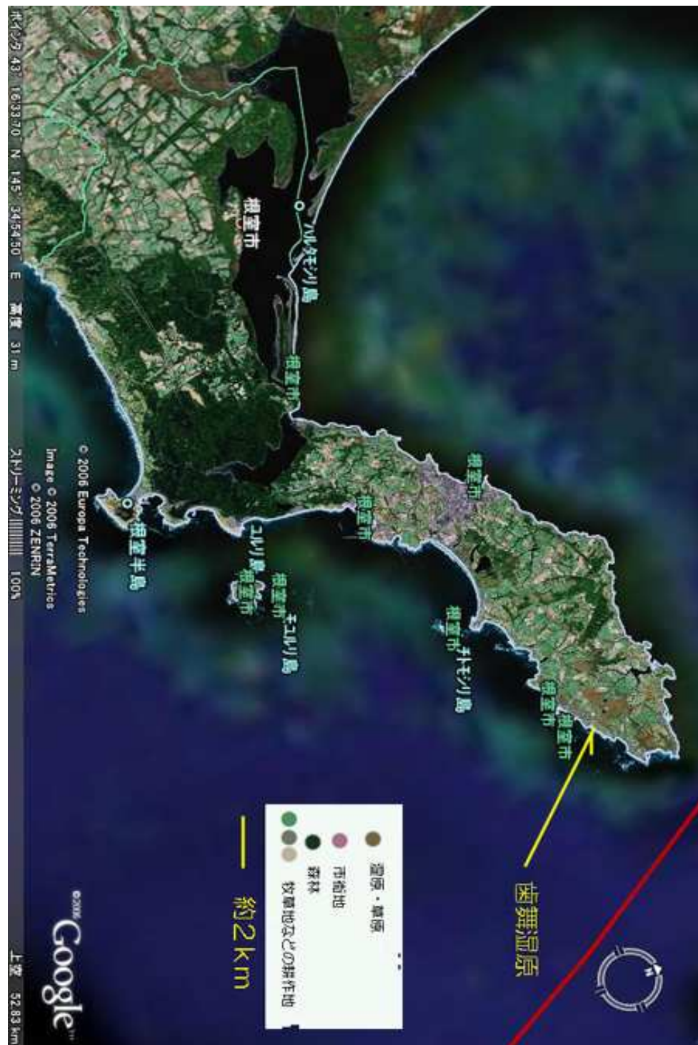
図3. 根室市周辺の衛星写真。湿原・草原の消失は顕著。